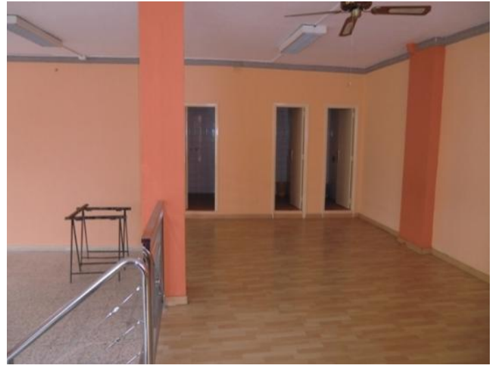
Blick auf die erhöhte Ebene