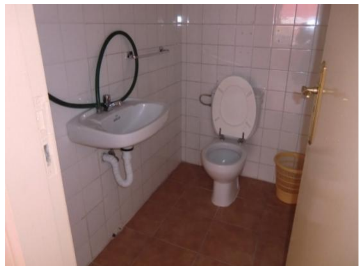
Die zweite Toilette

Alle Angaben nach bestem Wissen. Irrtum und Zwischenverkauf vorbehalten. Dieses Exposé ist eine Vorinformation, als Rechtsgrundlage gilt allein der notariell abgeschlossene Kaufvertrag.