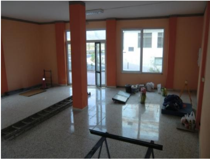
Große Fenster schaffen Einblick