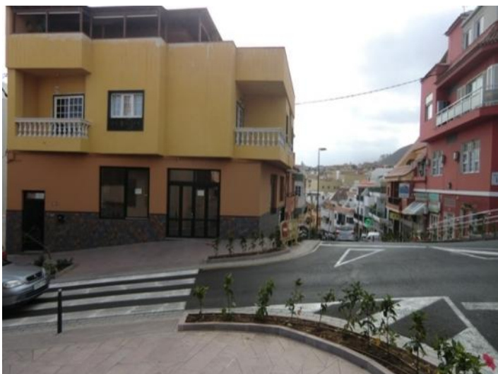
An eine Hauptstraße