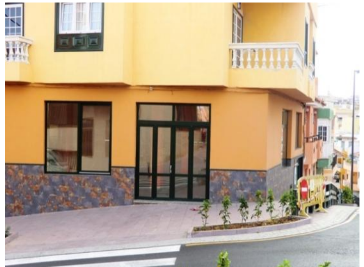
Ecklokal in guter Lage