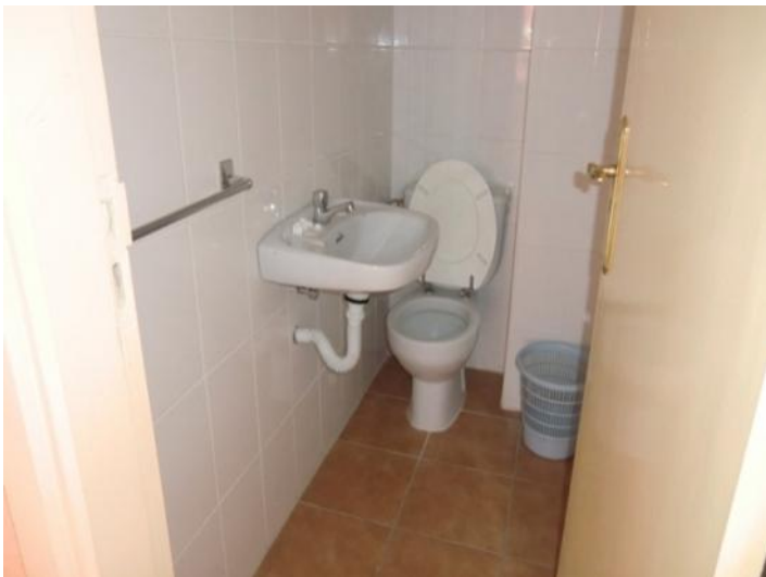
Eines der beiden Toiletten