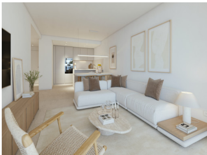
Wohn- und Essbereich mit Küche