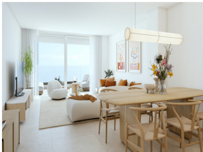
Wohn- und Essbereich mit Küche