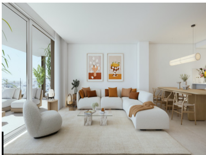
Wohn- und Essbereich mit Küche