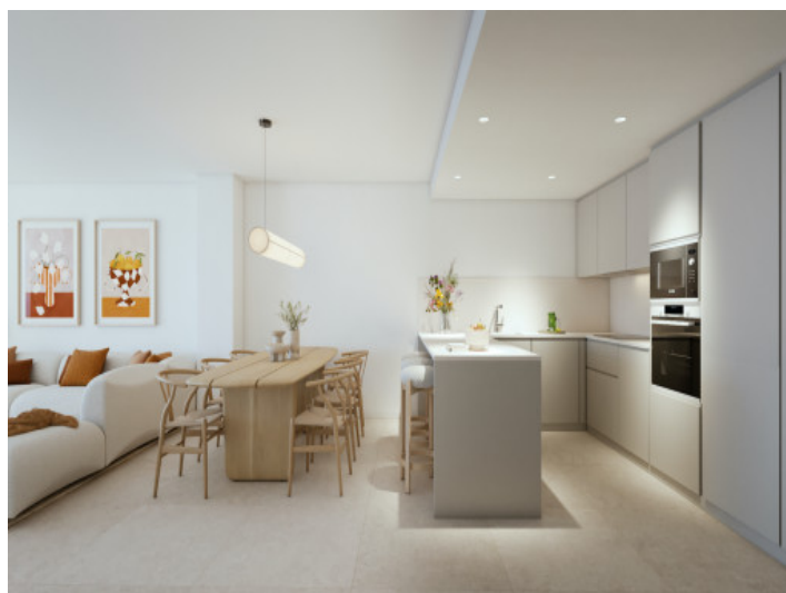
Wohn- und Essbereich mit Küche