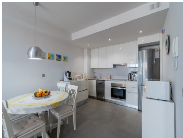
Küche und Essbereich