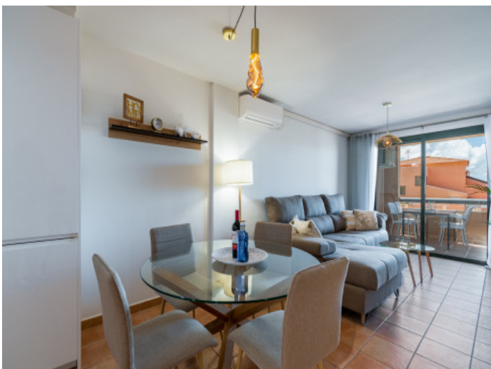
Wohnbereich und Essbereich