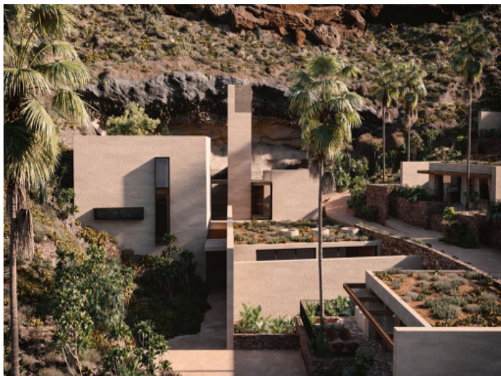
Architektur und Natur gehen ineinander über