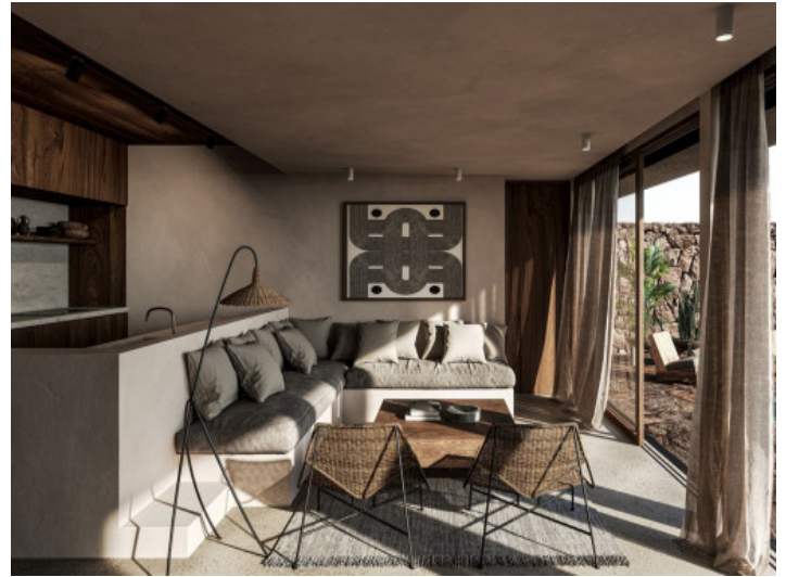
Eleganter Wohn- und Küchenbereich