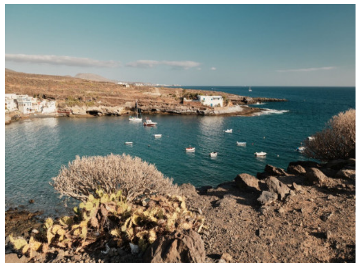
Der kleine Hafen

Alle Angaben nach bestem Wissen. Irrtum und Zwischenverkauf vorbehalten. Dieses Exposé ist eine Vorinformation, als Rechtsgrundlage gilt allein der notariell abgeschlossene Kaufvertrag.