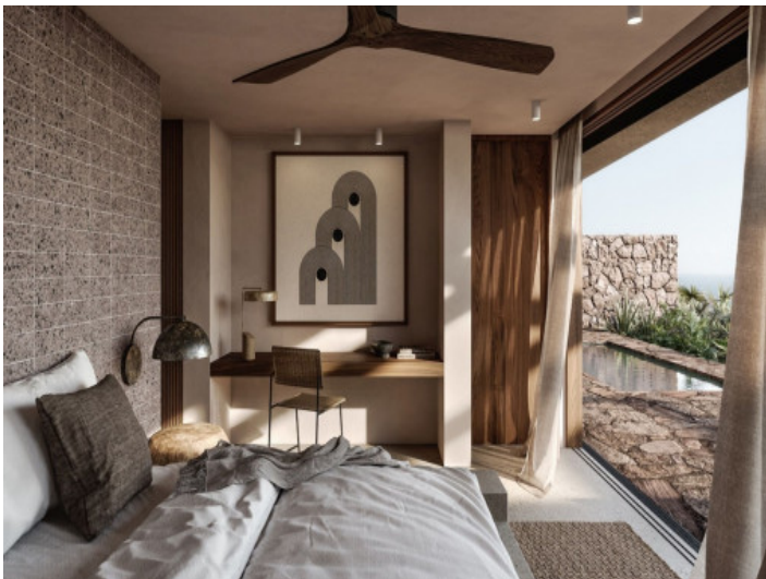
Gemütliches 2 Schlafzimmer Apartment