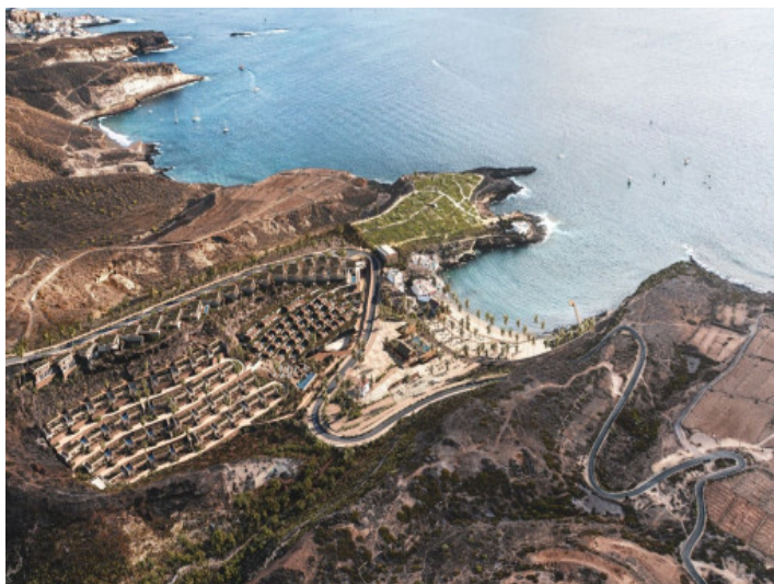
Ansicht und Lage