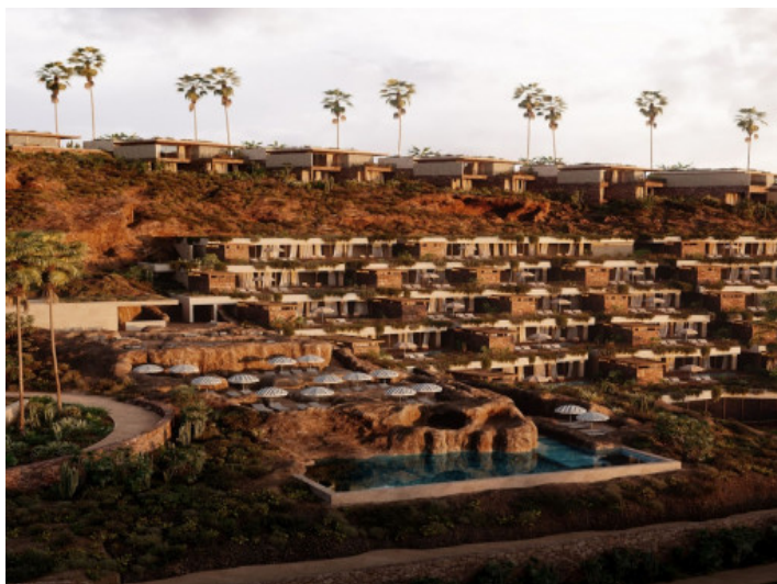
Ansicht auf diese exklusive Wohnanlage