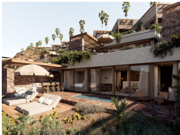
Wohnungen mit privatem Pool