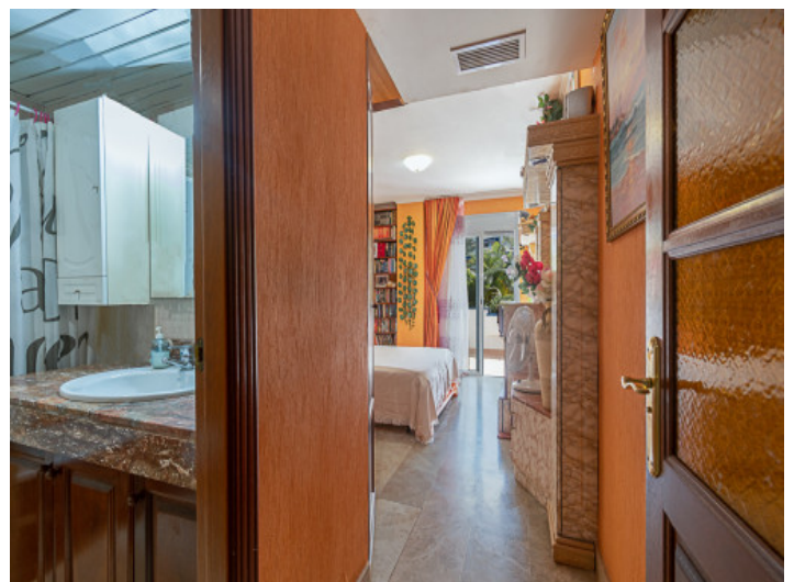
Badezimmer en suite

Alle Angaben nach bestem Wissen. Irrtum und Zwischenverkauf vorbehalten. Dieses Exposé ist eine Vorinformation, als Rechtsgrundlage gilt allein der notariell abgeschlossene Kaufvertrag.