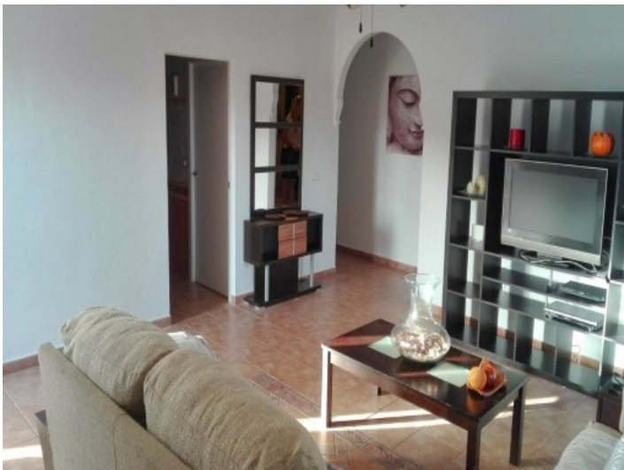
Alternative Ansicht des Wohnbereiches