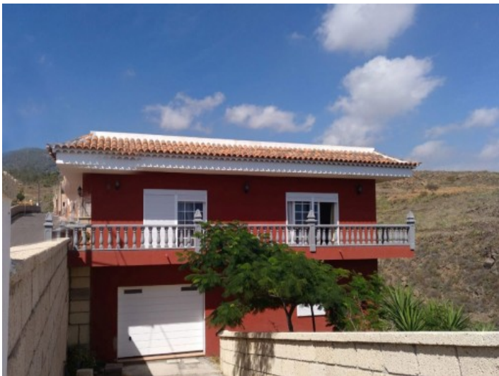
Rückansicht der Villa

Alle Angaben nach bestem Wissen. Irrtum und Zwischenverkauf vorbehalten. Dieses Exposé ist eine Vorinformation, als Rechtsgrundlage gilt allein der notariell abgeschlossene Kaufvertrag.