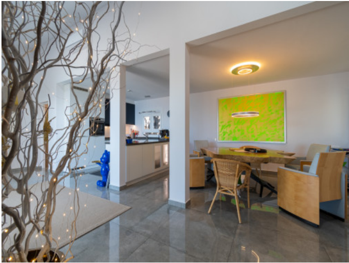
Ess- und Wohnbereich