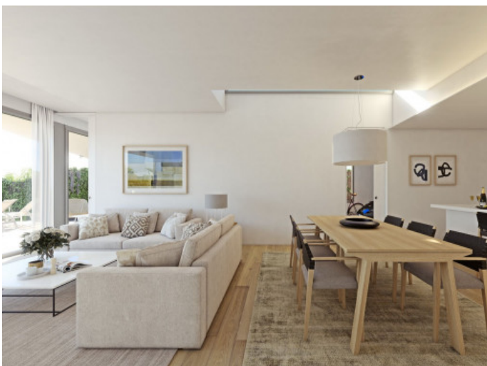
Küche, Wohn- und Essbereich

Alle Angaben nach bestem Wissen. Irrtum und Zwischenverkauf vorbehalten. Dieses Exposé ist eine Vorinformation, als Rechtsgrundlage gilt allein der notariell abgeschlossene Kaufvertrag.