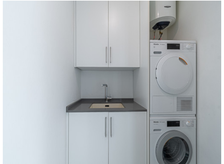
Hauswirtschaftsraum mit Waschmaschine und Trockner