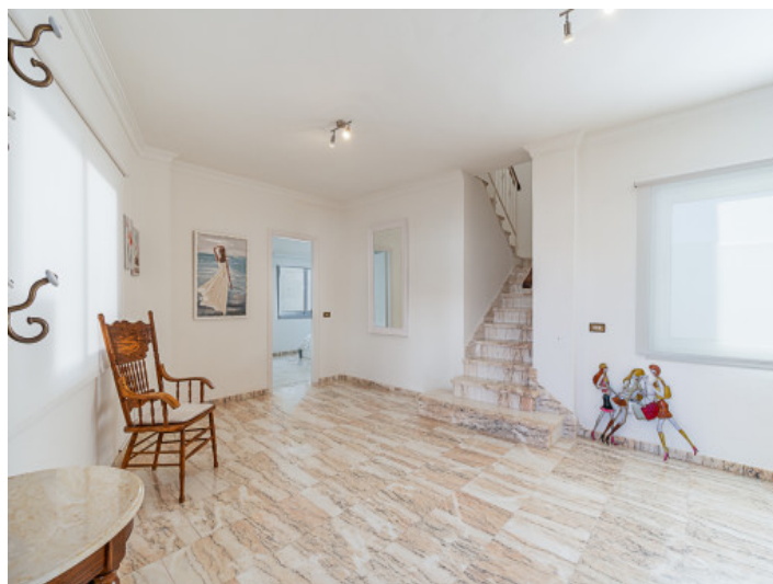
Eingangsbereich des Stadthauses

Alle Angaben nach bestem Wissen. Irrtum und Zwischenverkauf vorbehalten. Dieses Exposé ist eine Vorinformation, als Rechtsgrundlage gilt allein der notariell abgeschlossene Kaufvertrag.