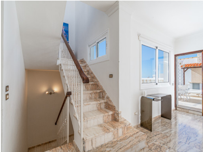
Eine Treppe führt in die verschiedenen Etagen des Stadthauses