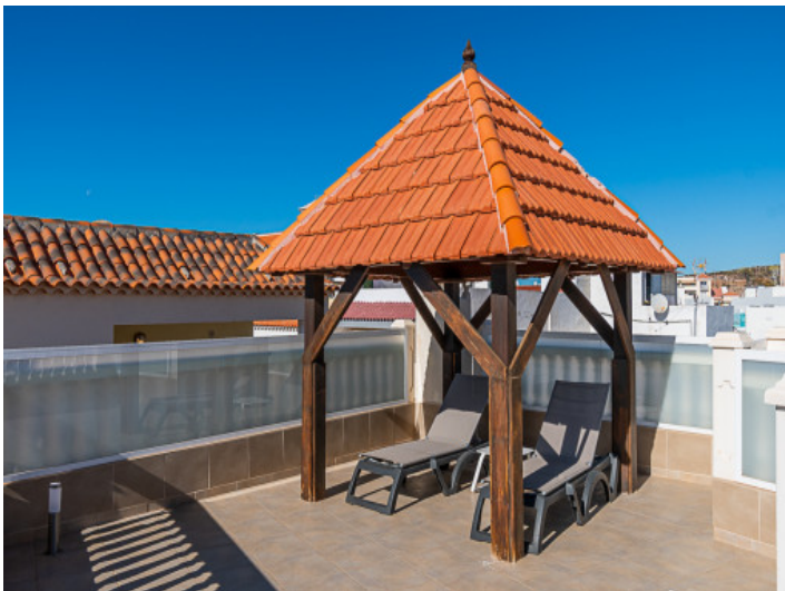
Terrasse mit Pavillon