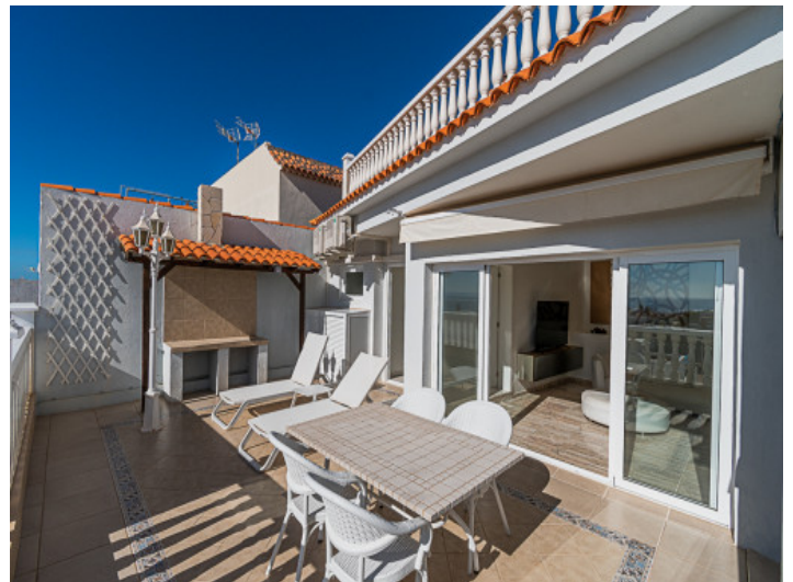
Essbereich auf der Terrasse