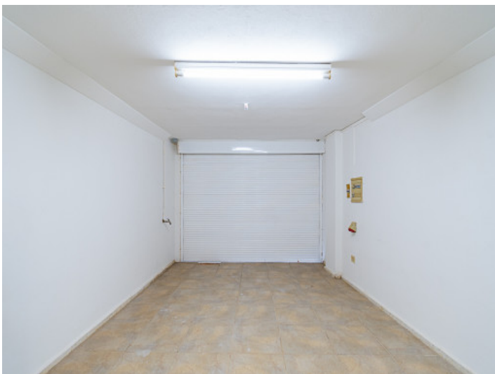
Garage des Stadthauses

Alle Angaben nach bestem Wissen. Irrtum und Zwischenverkauf vorbehalten. Dieses Exposé ist eine Vorinformation, als Rechtsgrundlage gilt allein der notariell abgeschlossene Kaufvertrag.