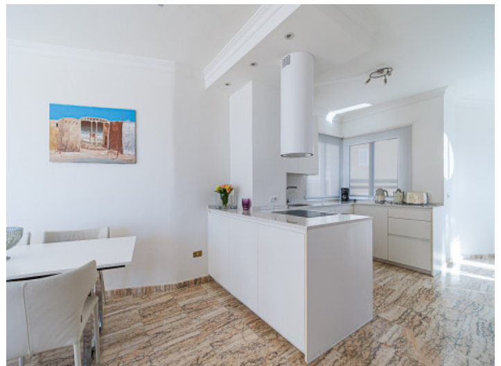
Offene Küche und Essbereich

Alle Angaben nach bestem Wissen. Irrtum und Zwischenverkauf vorbehalten. Dieses Exposé ist eine Vorinformation, als Rechtsgrundlage gilt allein der notariell abgeschlossene Kaufvertrag.