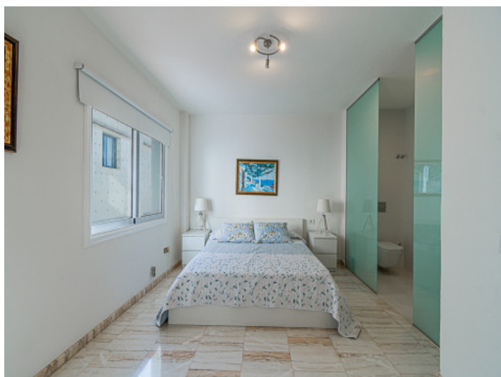
Gemütliches Schlafzimmer mit Badezimmer en Suite