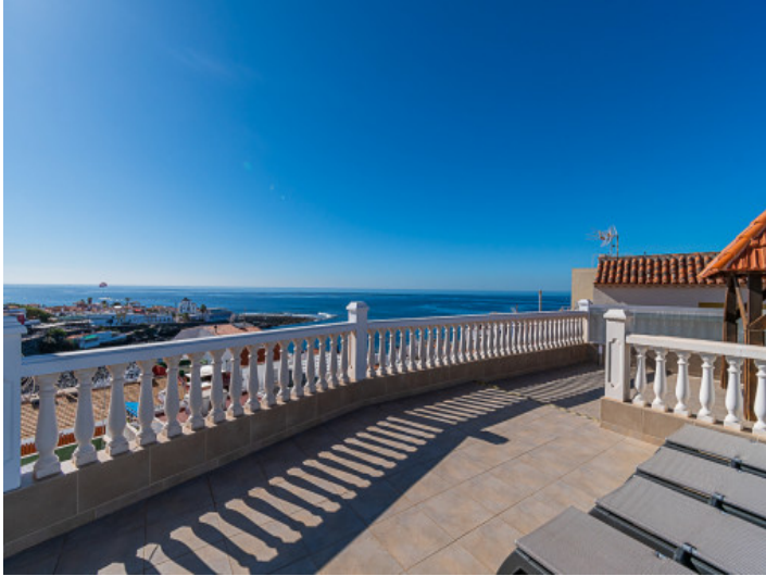
Einmaliger Meerblick vom Balkon