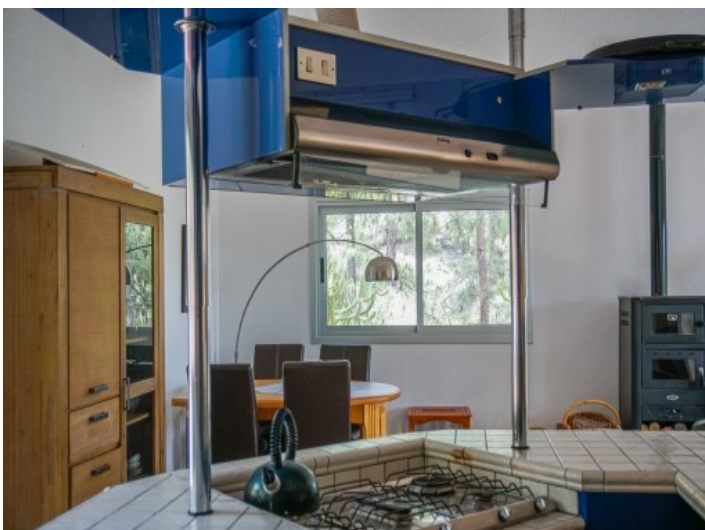
Ansicht der Küche