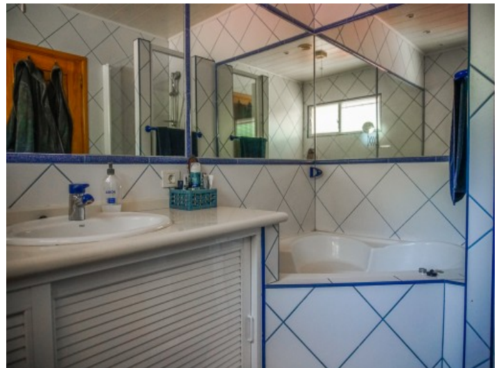
Eines der 5 Badezimmer