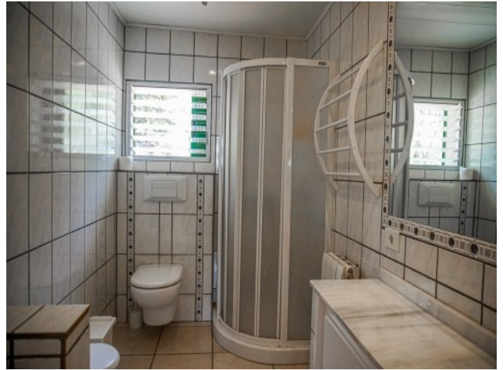
Eines der 5 Badezimmer