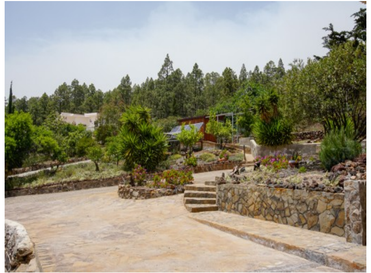
Außenansicht des Anwesens