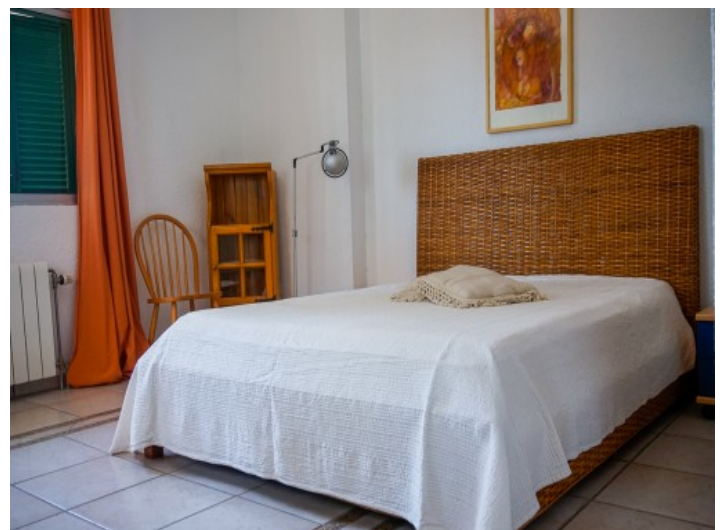
Eines der 5 Schlafzimmer

Alle Angaben nach bestem Wissen. Irrtum und Zwischenverkauf vorbehalten. Dieses Exposé ist eine Vorinformation, als Rechtsgrundlage gilt allein der notariell abgeschlossene Kaufvertrag.