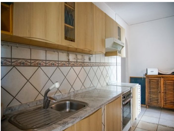
Küche Apartment 3