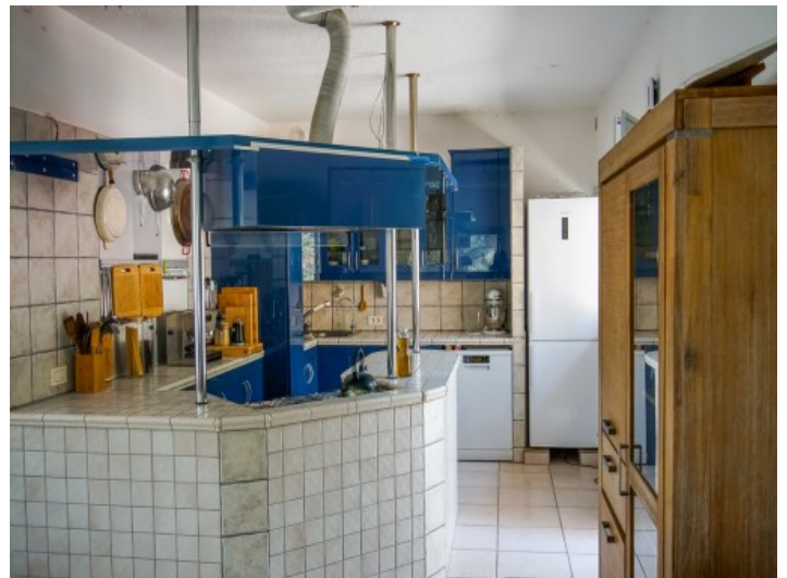
Ansicht der Küche