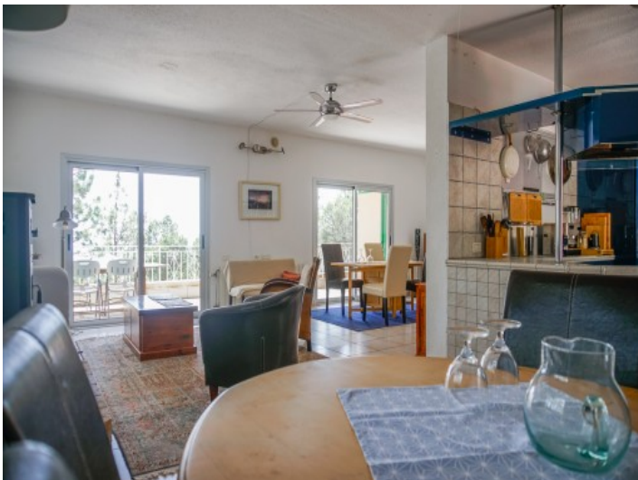
Offener Wohnbereich und Küche