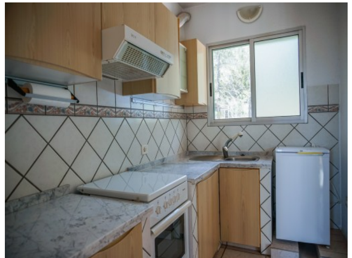
Küche Apartment 2