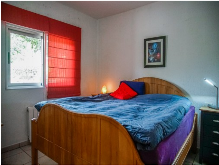
Eines der 5 Schlafzimmer