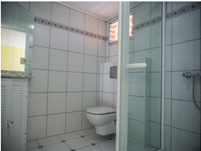
Eines der 5 Badezimmer