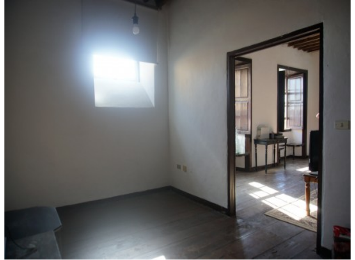
Ansicht des Schlafzimmers