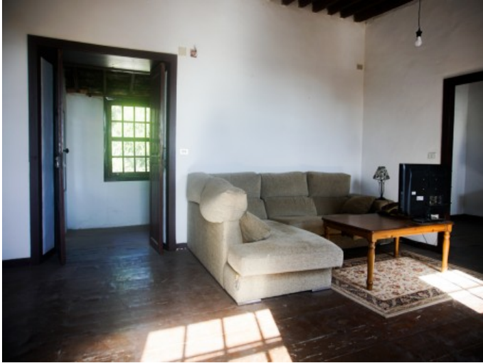
Wohnbereich des Hauses