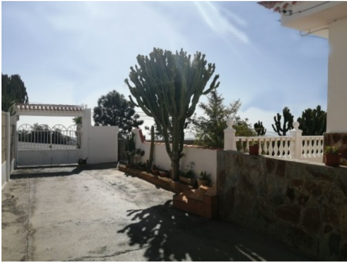
Auffahrt des Hauses