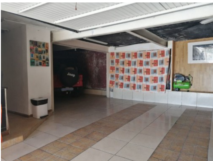
Garage des Hauses

Alle Angaben nach bestem Wissen. Irrtum und Zwischenverkauf vorbehalten. Dieses Exposé ist eine Vorinformation, als Rechtsgrundlage gilt allein der notariell abgeschlossene Kaufvertrag.