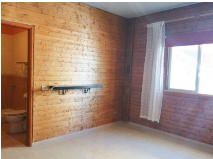
Schlafzimmer mit Badezimmer en Suite