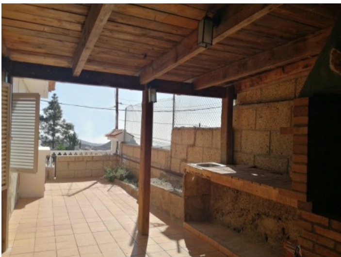
Überdachte Terrasse mit Außenküche