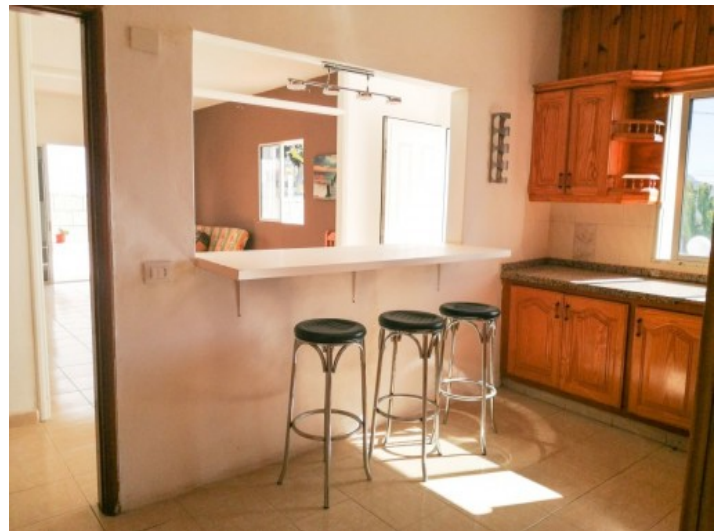
Küche mit Blick in den Wohnbereich