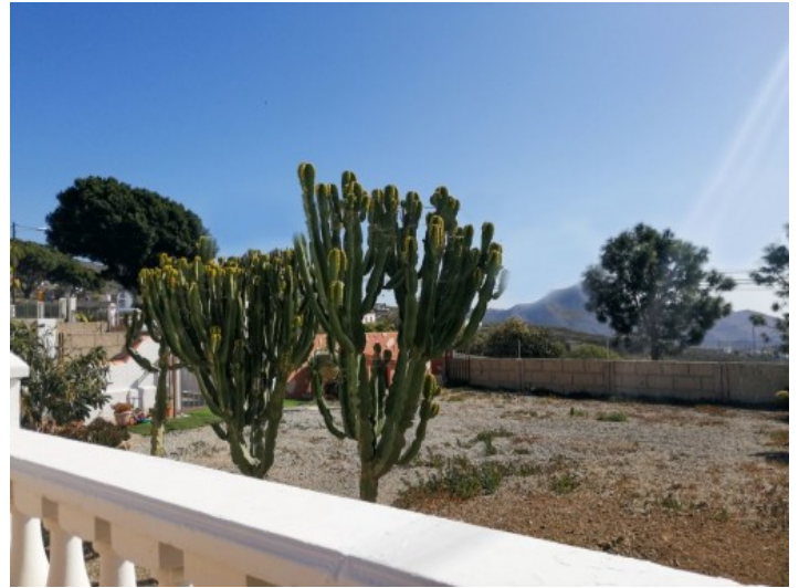
Ausblick in den Garten