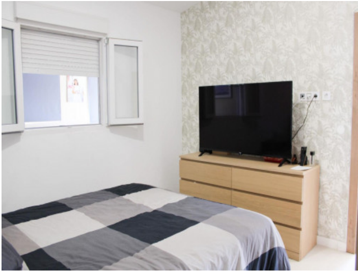
Finca mit 2 Schlafzimmern