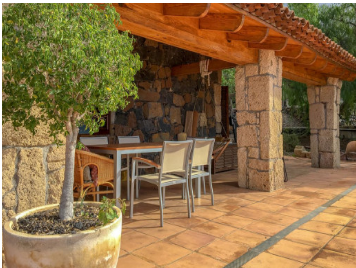
Geräumige Terrasse mit Essbereich im Freien