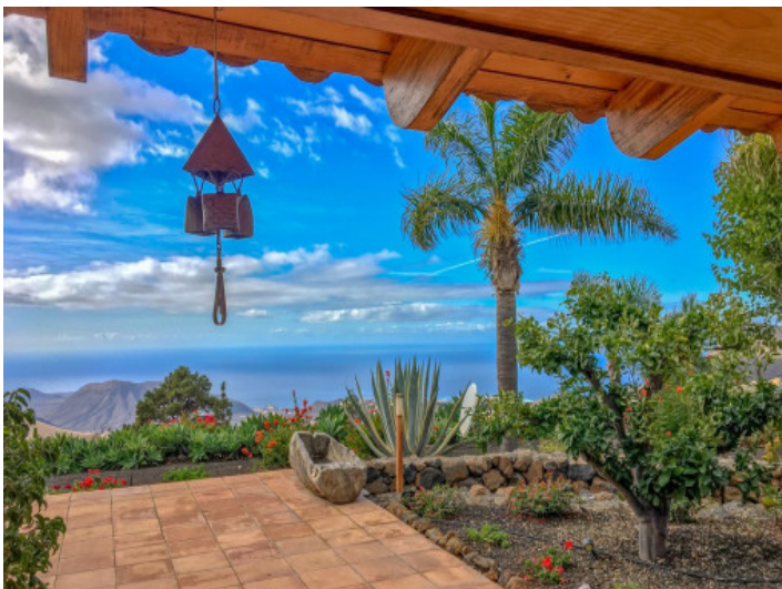
Beeindruckender Meerblick von der Terrasse