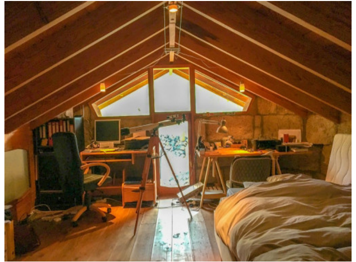
Arbeitsbereich im Dachgeschoss