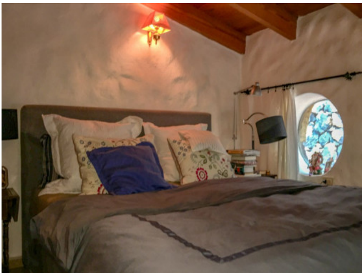
Eines von 6 Schlafzimmern