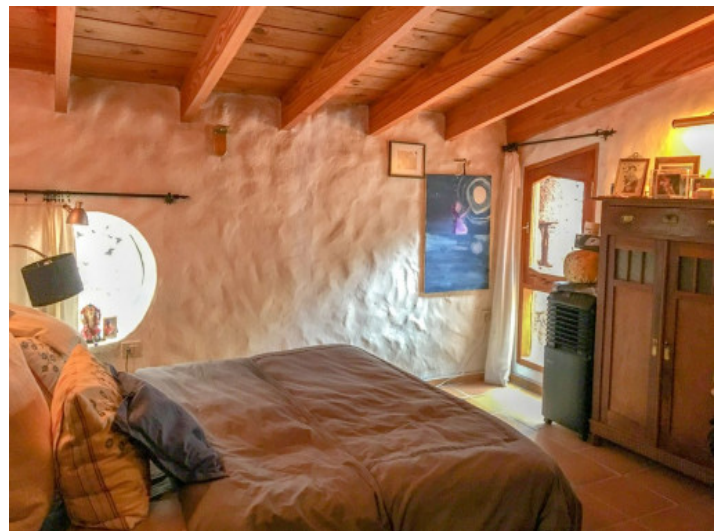
Eines von 6 Schlafzimmern

Alle Angaben nach bestem Wissen. Irrtum und Zwischenverkauf vorbehalten. Dieses Exposé ist eine Vorinformation, als Rechtsgrundlage gilt allein der notariell abgeschlossene Kaufvertrag.