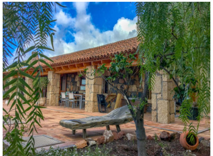
Alternative Ansicht der überdachten Terrasse

Alle Angaben nach bestem Wissen. Irrtum und Zwischenverkauf vorbehalten. Dieses Exposé ist eine Vorinformation, als Rechtsgrundlage gilt allein der notariell abgeschlossene Kaufvertrag.