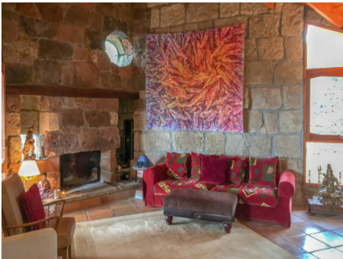
Gemütlicher Wohnbereich mit Kamin