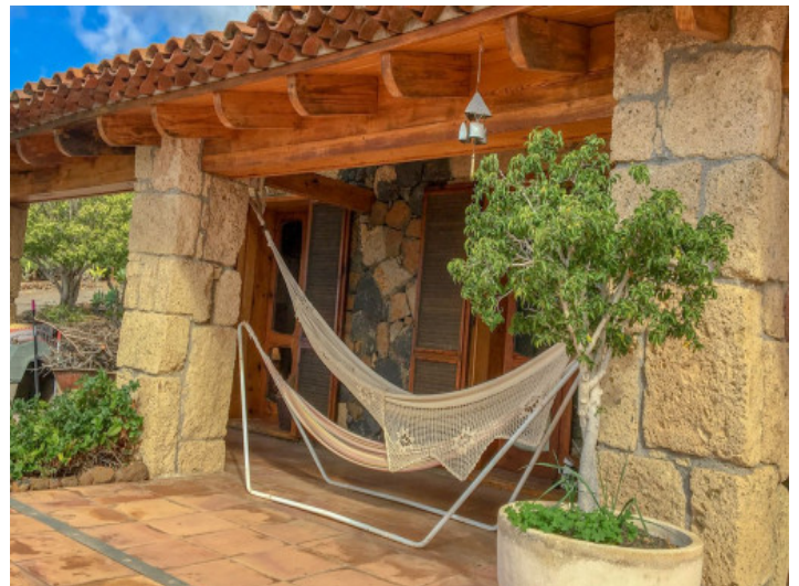
Terrasse mit Charm