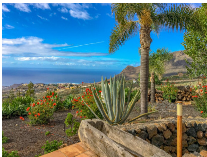
Alternative Ansicht des Gartens

Alle Angaben nach bestem Wissen. Irrtum und Zwischenverkauf vorbehalten. Dieses Exposé ist eine Vorinformation, als Rechtsgrundlage gilt allein der notariell abgeschlossene Kaufvertrag.