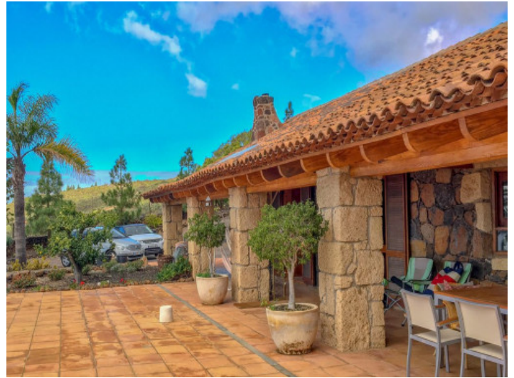
Teilweise überdachte Terrasse