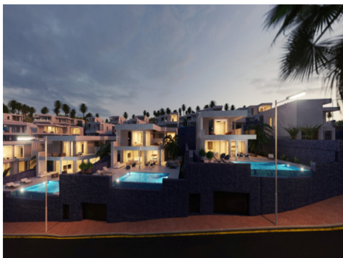
Außenansicht der Villa

Alle Angaben nach bestem Wissen. Irrtum und Zwischenverkauf vorbehalten. Dieses Exposé ist eine Vorinformation, als Rechtsgrundlage gilt allein der notariell abgeschlossene Kaufvertrag.