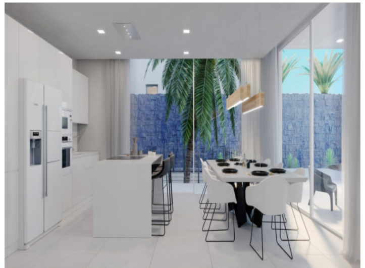
Küche und Essbereich