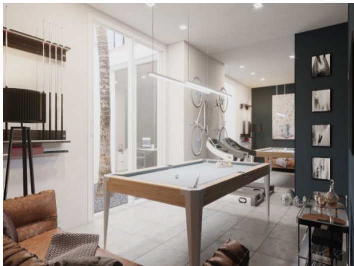
Büro und Hobbyraum