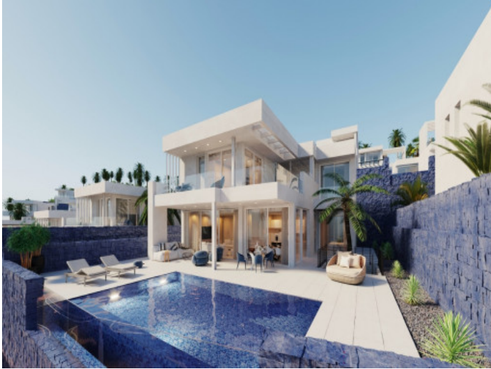
Außenansicht der Villa